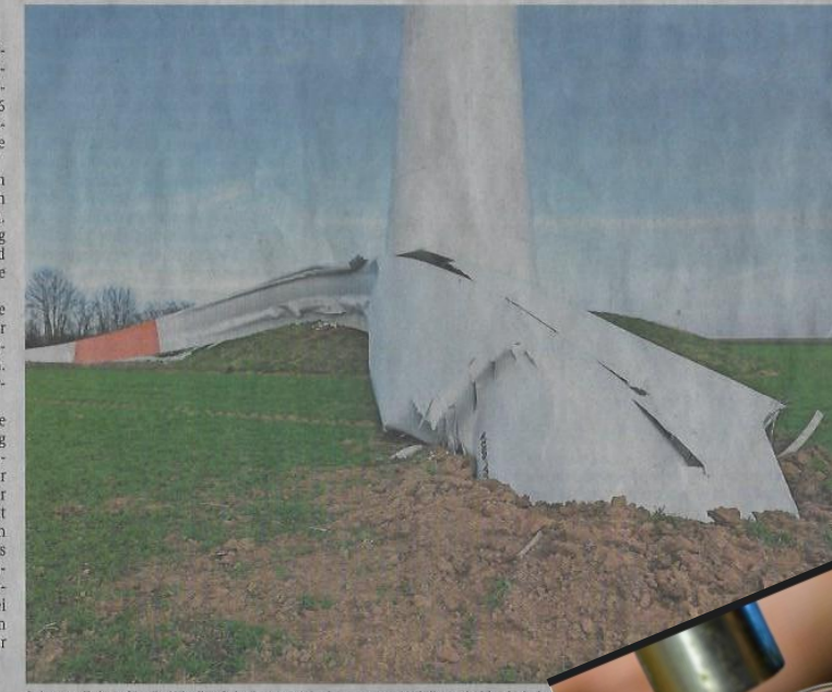
Schwere Zeiten für die Windkraft in Bayern: Weniger wegen Unfällen wie hier bei einer...